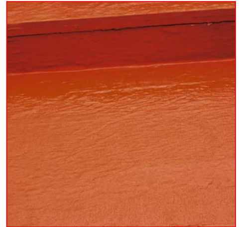
5 Fertige Dachbeschichtung mit DAKORIT® Reflex 20D .