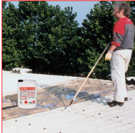
1 Sandende Flächen, Beton und Faserzement mit VESTEROL® TG 10D vorstreichen.

Vorhandene Blasen bei alten Bitumen-Abdichtungen beseitigen.