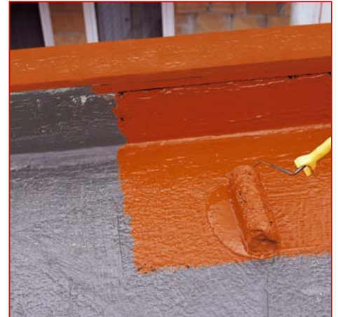
2 Der Anstrich erfolgt unverdünnt mit Rolle, Pinsel, Quast oder im Airless-Spritzverfahren.