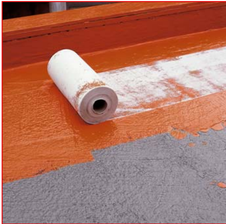
3 In rissgefährdeten Zonen und Dächern mit Pfützenbildung sind zwei Anstriche erforderlich. In den 1. Anstrich wird DAKORIT® DV110 89V eingearbeitet.