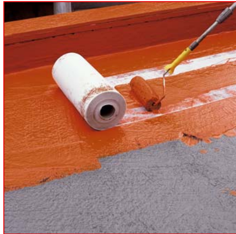
4 DAKORIT® DV110 89V einarbeiten und satt überstreichen.