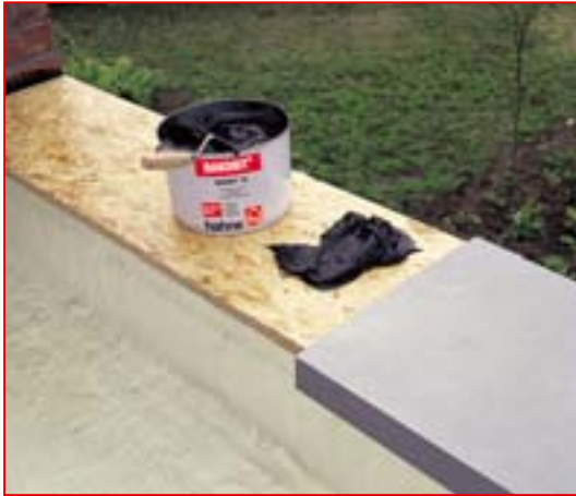
1 DAKORIT® ES vor Ort aus dem Gebinde entnehmen ...