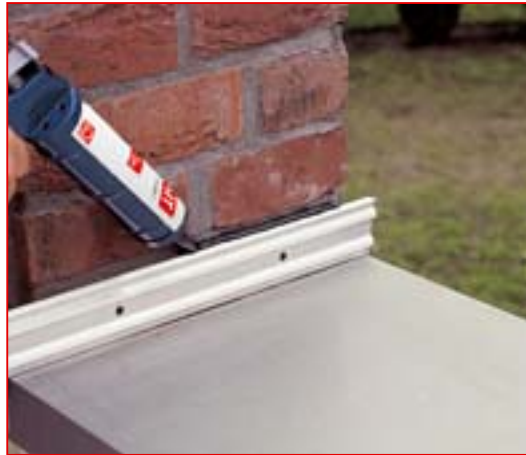
4 Fugen nachträglich mit DAKORIT® BK-Flex abdichten.