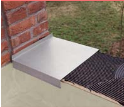
3 Nach kurzem Ablüften – Bleche fixieren und andrücken.