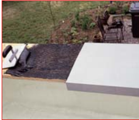
2 ... direkt auftragen und mit Zahnglätter verteilen.